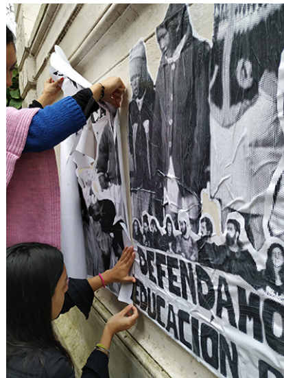
Fotografía 6: Producción del figurón colectivo.

Desde WACHA, valoramos y disfrutamos mucho el desafío de la materia con los procesos detrás y sobre cada acción, con la construcción con las y los jóvenes estudiantes. Celebramos y agradecemos que exista este espacio para acercar propuestas pedagógicas alternativas y diversas que promuevan el intercambio de experiencias y perspectivas y que fortalezcan horizontes de formación crítica en el marco de las instituciones educativas públicas. ¡Por más arte desde y para las pibas y los pibes!