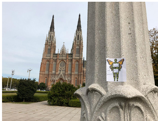
Fotografía 2: Sticker producido por Catalina.

Así, la propuesta de una de las alumnas, Catalina, se enfocó en cuestionar las representaciones asignadas a los cuerpos heteronormados, ubicando en un cuerpo no hegemónico recortes combinados de fragmentos del binomio mujer/hombre. Estos cuerpos, además,